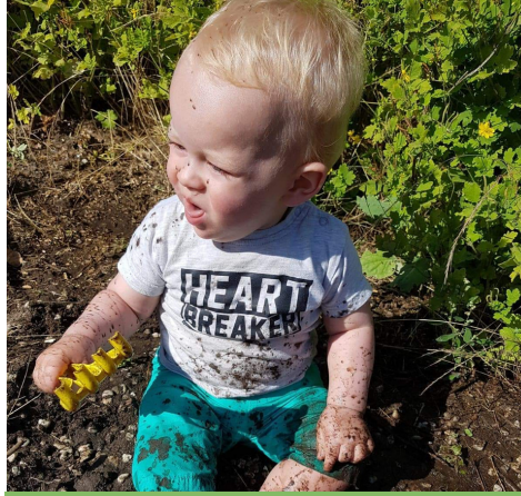
Vies worden hoort erbij.