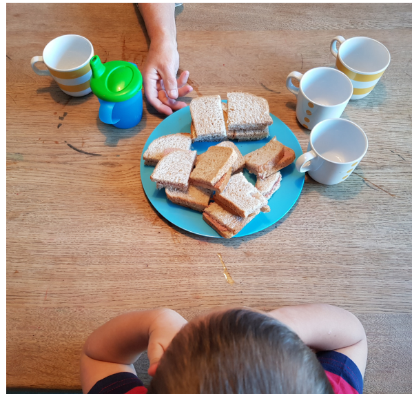
Eet maar lekker op!

De kinderen die de hele dag blijven eten na 12.00 uur gezamenlijk boterhammen en krijgen water bij hun lunch.