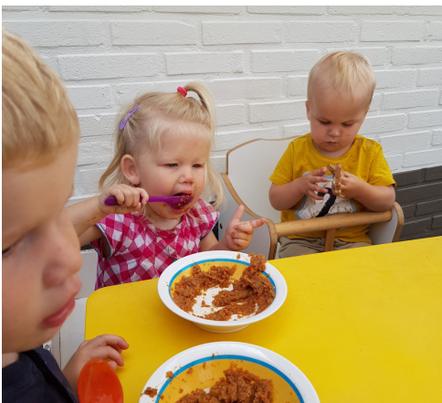
Handig als je kindje al heeft gegeten!