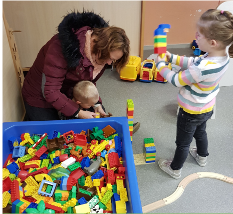
Kan jij ook een toren maken?