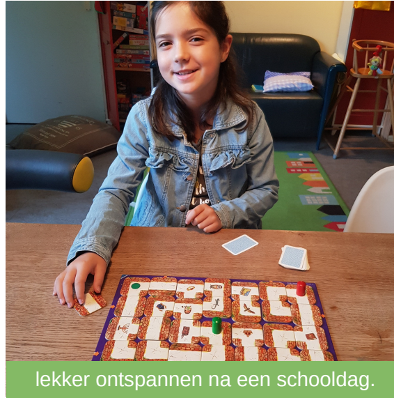
lekker ontspannen na een schooldag.

In de middag halen we de kinderen van beide basisscholen in Susteren voor een paar uurtjes BSO. Afhankelijk van de groepssamenstelling bieden we de kinderen van de BSO een apart programma, maar vaak wijst de praktijk uit dat de oudere kinderen het erg leuk vinden om samen met de kleintjes te spelen.