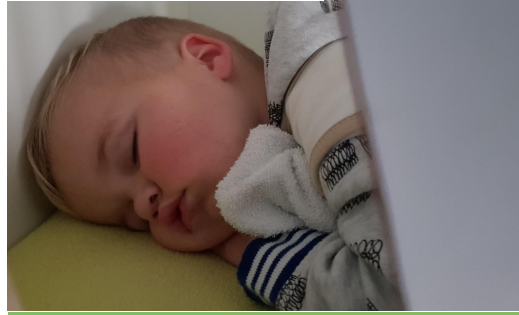
Mijn eigen doekje ruikt naar thuis.

Na het eten is het tijd voor een middag dutje en uiteraard zorgen we dat de slaaprituelen van thuis worden overgenomen. Met de meegenomen knuffels en eventueel een slaapzak, voelt het bijna als thuis. Heerlijk om even te kunnen slapen!