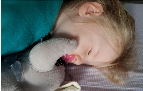
Mijn knuffel is de liefste.