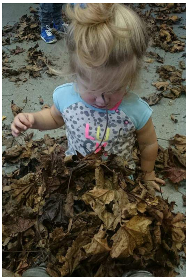
Binnen met blaadjes spelen, wat een feest!.

Daarna gaan we lekker buiten spelen, ravotten, de kippen 'Roodkapje' en 'Kikker' eten geven. En natuurlijk eitjes rapen.