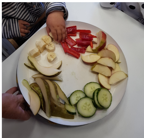
Dat zal lekker smaken!