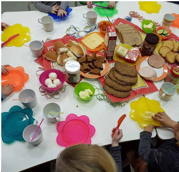
Smakelijk eten allemaal.