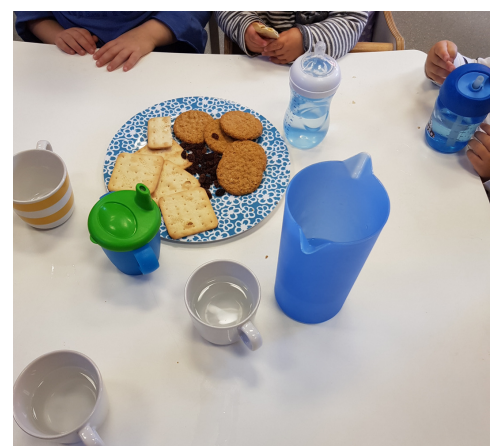
En dan een lekker koekje!

Rond 10.00 uur ruimen we samen op. Daarna gaan we lekker fruit eten en water drinken. Tijdens het schoonmaken van het fruit, zingen we samen liedjes. We sluiten af met een verantwoord koekje.