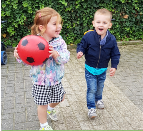
Ja, met de bal!