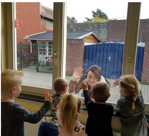
Dag mama!. Hou van jou!