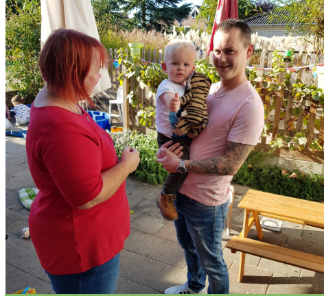
Mag ik morgen weer naar Pit?!