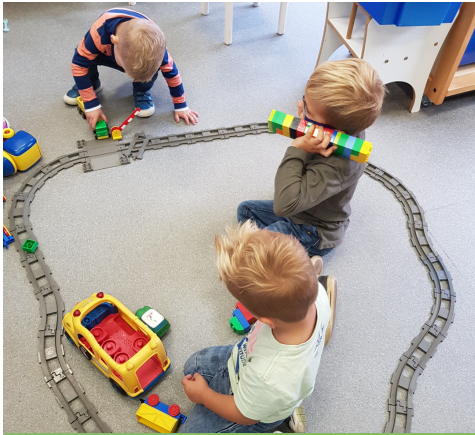
Tjoeketjoeke puf, puf.