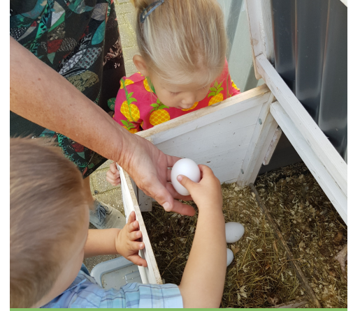
Dank je wel lieve kip!

Daarna gaan we lekker buiten spelen, ravotten, de kippen 'Roodkapje' en 'Kikker' eten geven. En natuurlijk eitjes rapen.