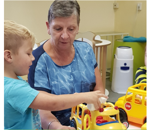
Oma, kijk eens wat ik kan!

Ouders die hun kinderen brengen, spelen even mee met hun kind. De ouders vertellen ons hoe het thuis is gegaan en of we rekening moeten houden met bijzonderheden voor die dag. Er is ook altijd tijd om ons vragen te stellen.