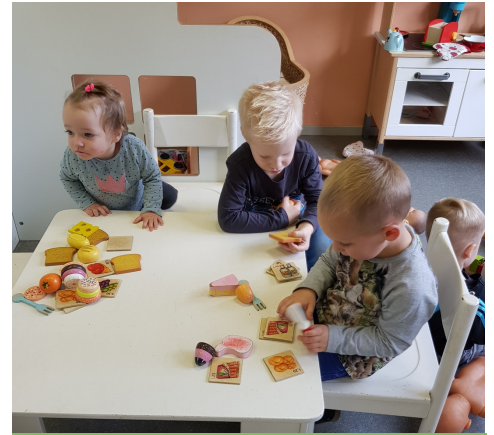
Zullen wij samen spelen?

Als alle papa's en mama's rond 8.45 uur weg zijn, mogen de kinderen vrij spelen met alle materialen die aanwezig zijn. Zomers bij warm weer starten we dag vaak buiten, waar we de hele ochtend dan lekker kunnen ravotten en spelen.