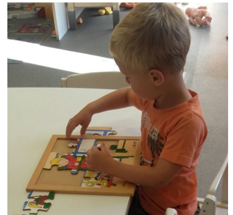
Ik ben al lekker aan het spelen!

Afscheid nemen valt soms niet mee voor kleine kindjes, maar ook papa en mama hebben het soms moeilijk. Hier nemen we de tijd voor, om het voor jullie en je kindje wat makkelijker te maken.