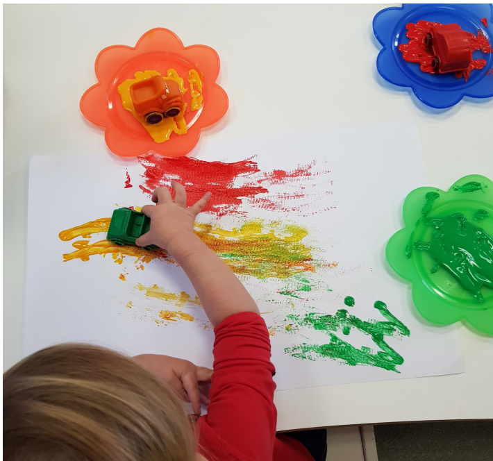
Kunstenars in de dop.