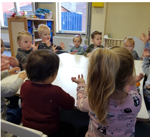
Op een grote paddenstoel...