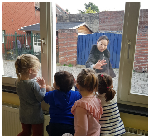
Doei, doei tot vanavond.