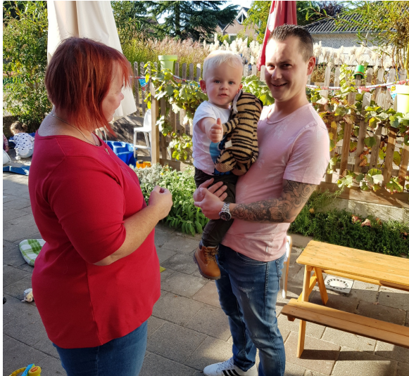
Ik heb de kipjes gevoerd, papa

Om 12.00 uur worden de kinderen die alleen de peuterspeelzaal ochtend komen opgehaald. We vertellen samen met het kind aan papa, mama, opa of oma welke avonturen we die ochtend hebben beleefd. Hoe het is gegaan en geven eventuele bijzonderheden door.