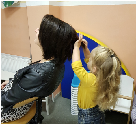
Ik maak je nog even mooi, mam.