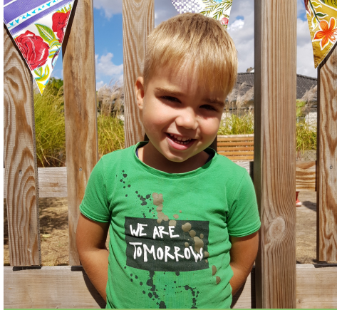
Ik vind buitenspelen het leukste!