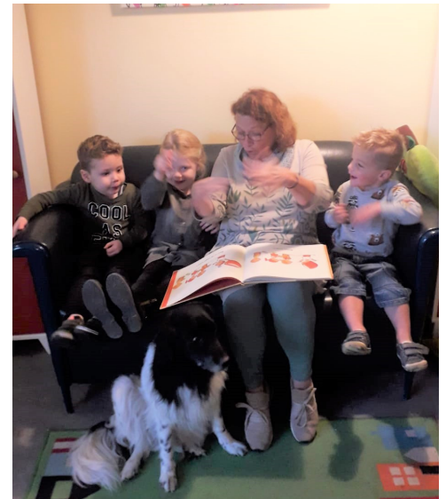
En toen zei de kabouter...

Alleen veel regen of extreme kou zorgt ervoor dat we niet buiten gaan spelen. Maar dan spelen we binnen met de natuur!